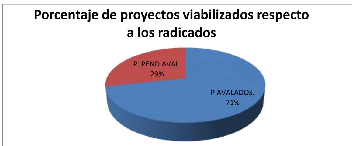
Grafico 4-Elaboracion propia

Realizando el mismo ejercicio planteado con el indicador de la meta de producto anterior, podemos realizar la apreciación que se encuentran avalados el 71% de los proyectos que fueron radicados ante la gobernación de Cundinamarca, esto tomando como denominador los 7 proyectos nombrados anteriormente y como numerador los que cuentan viabilidad técnica.