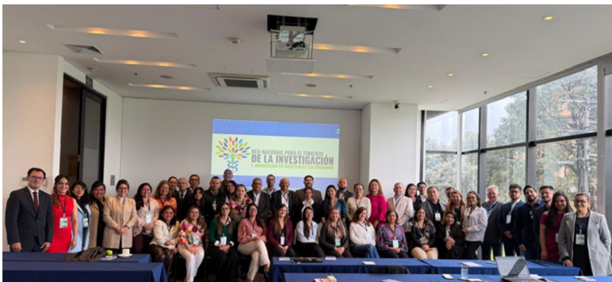
Líderes de Investigación de las 23 IPS miembros de la Red I2 en el primer evento presencial de la Red, Bogotá D.C. 2025.

El evento reunió a líderes de investigación e innovación de los hospitales miembro de 13 departamentos y Bogotá D.C., con el propósito de construir la Planeación Estratégica, realizar la primera Asamblea y elegir la Junta 2025-2027, para fortalecer capacidades institucionales en la generación de conocimiento. Además, la Red I2 invitó a representantes del Ministerio de Salud y Protección Social (Dirección de Medicamentos y Tecnologías en Salud), Invima, Organización Panamericana de la Salud, AFIDRO y ADRES quienes realizaron el panel “Retos y Oportunidades para la I+I+E en Hospitales del país”. Por lo pronto, entre los retos para la Red I2 son: Confianza, la información de calidad, el planteamiento de prioridades (corto, mediano y largo plazo), la fuga de cerebros, el déficit de apropiación social, los desafíos éticos, los desafíos ambientales y la regulación de la soberanía sanitaria. El HUS es miembro fundador de la Red I2 junto con 22 hospitales en 13 departamentos y la Red de Salud de Bogotá D.C. Finalmente, la creación de la Red I2 marca un hito en la articulación entre hospitales con diferencias en la experiencia de generación de conocimiento y vulnerabilidad territorial para fortalecer las capacidades nacionales en investigación e innovación.