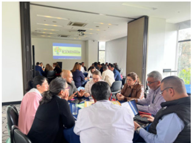
Líderes de Investigación de la Red I2 construyendo la Planeación Estratégica de la Red.