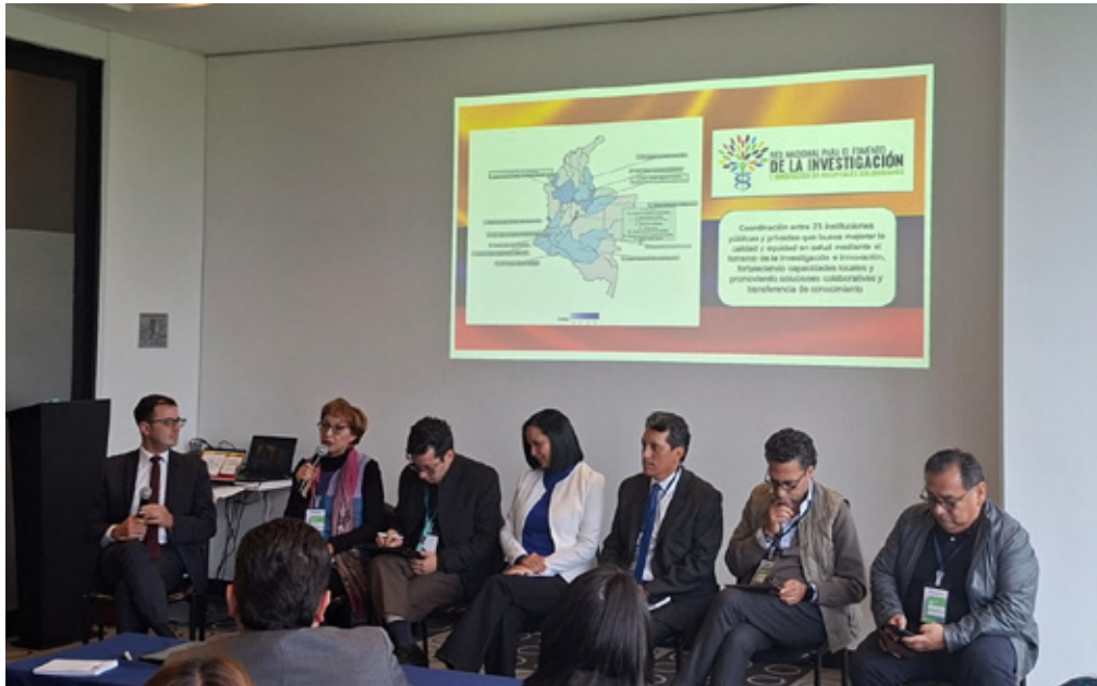
Panelistas “Retos y Oportunidades para la I+I+E en Hospitales del país”, Red I2, 2025.

Junta Directiva 2025-2027 de la Red I2: Hospital Universitario Nacional de Colombia, Hospital Universitario del Valle Evaristo García ESE (Cali), ESE Hospital José María Hernández (Mocoa), Instituto Nacional de Cancerología (Bogotá) y Hospital Universitario Erasmo Meoz (Cúcuta).